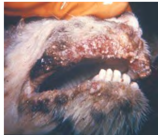
Эрозивные поражения ротовой полости

Профилактика основана на комплексе мероприятий по предотвращению заноса заболевания в РФ.