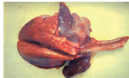
Застойные явления долей легких.