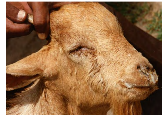
Выделения из глаз, носа и рта