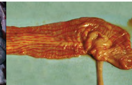
Толстая кишка, с полосами кровоизлияний («полоски зебры») на складках слизистой оболочки.